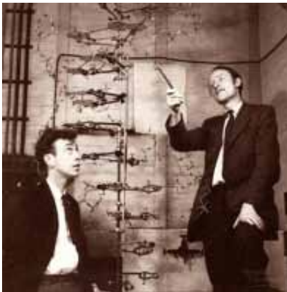
Figura 1. James Dewey Watson (1928) y Francis Harry Compton Crick (1916-2004) ante un modelo de lámina de la estructura del ADN

Fuente: A Signet Book-The New American Library, Nueva York 1969.